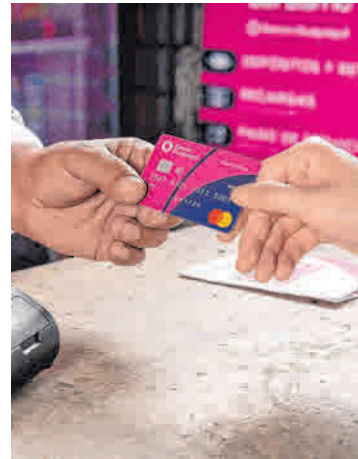
Banco del Barrio facilita la apertura de cuenta amiga a sus clientes para poder recibir el bono de desarrollo humano

Gracias a su amplia oferta de servicios y su compromiso con la inclusión, Banco del Barrio se ha consolidado como un pilar fundamental para millones de ecuatorianos, brinda soluciones prácticas que transforman vidas y fortalecen el tejido social en todo el país.